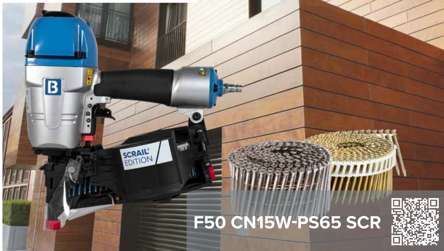
F50 CN15W-PS65 SCR